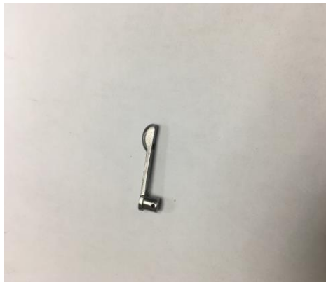
Aleta seguro Holland.