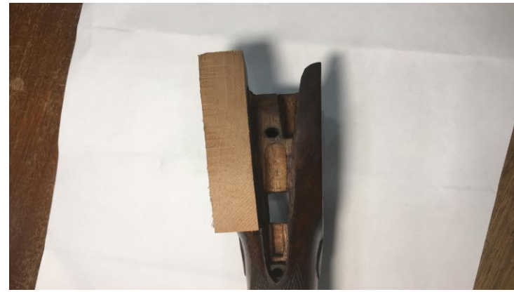
RECONSTRUCCIÓN DE PIEZAS.