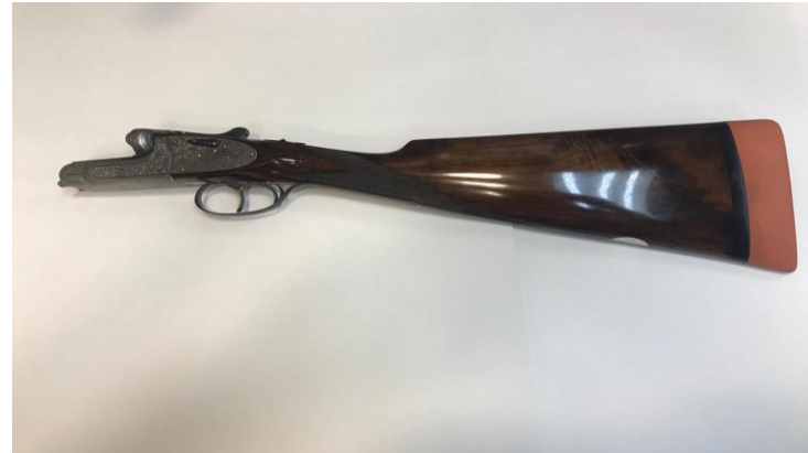
RESTAURACIÓN AL ACEITE.