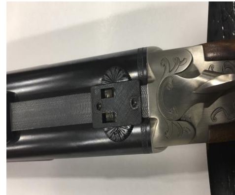
“RESTAURACIÓN PIEZAS PICADAS”.