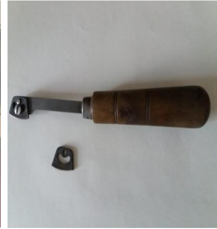
Cuchilla para hacer picados en madera.

“FABRICACIÓN MANUAL DE PIEZAS A PARTIR DE UN TACO DE ACERO”.