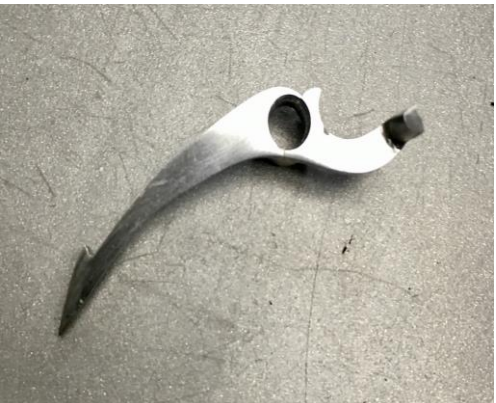
Doble seguro inglés.